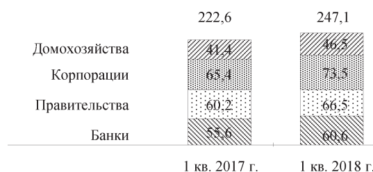
Рис. 2. Динамика мирового долга, трлн долл. США

Более трети глобального долга это – корпоративная задолженность, которая с начала текущего столетия имела следующую динамику роста: 2000 г. – 26 трлн долл.