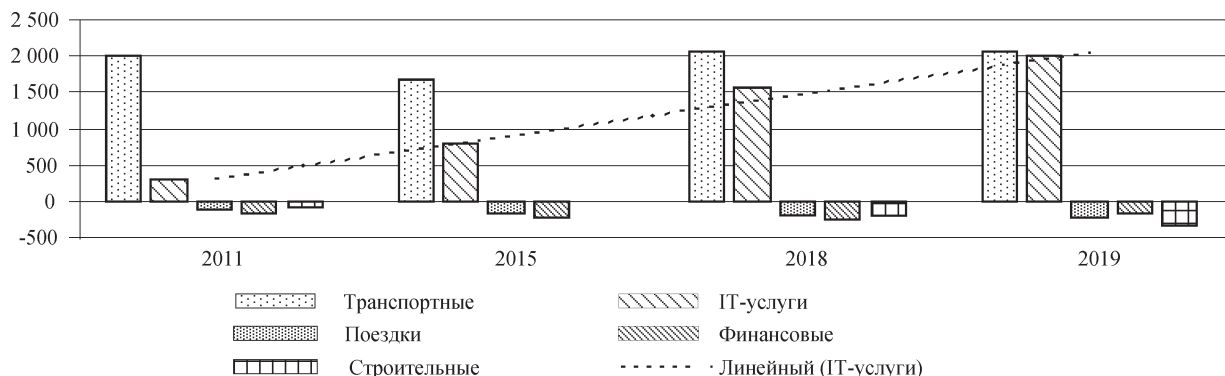
Рис. 3. Сальдо внешней торговли основными услугами в Республике Беларусь, 2011–2019 гг., млн долл. США