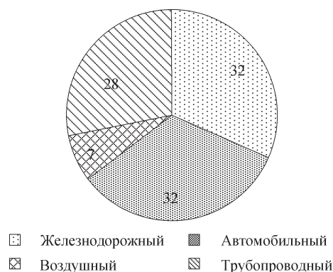
Рис. 5. Структура внешней торговли транспортными услугами в Республике Беларусь по основным видам транспорта, 2020 г., %