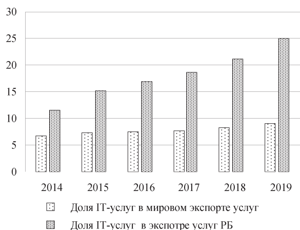
Рис. 4. Доля ИТ-услуг в экспорте услуг в мире и в Республике Беларусь, 2014–2019 гг., %