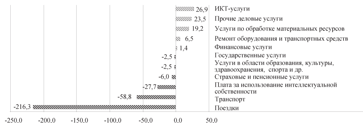
Рис. 2. Вклад различных видов услуг в формирование сальдо торговли услугами Китая в 2019 г., млрд долл. США