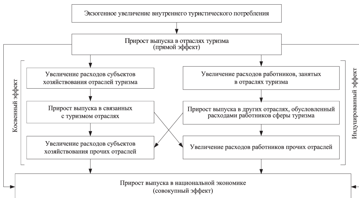
Рис. 2. Схема мультипликативного воздействия туристического потребления на национальную экономику по цепочке расходов

Количественная оценка влияния субфункций туризма производится посредством расчета туристического мультипликатора, который наиболее полно отражает влияние развития отрасли на состояние национальной экономики. Как показатель он представляет собой коэффициент, выражающий интегральный результат (прямое,