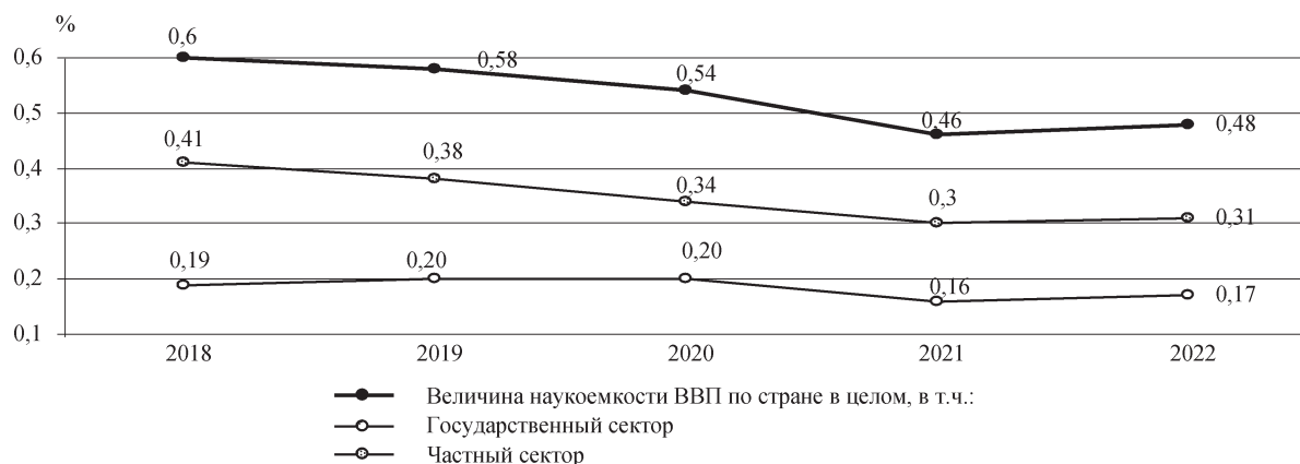
Рис. 2. Наукоемкость ВВП Беларуси по секторам экономики, 2018–2022 гг.