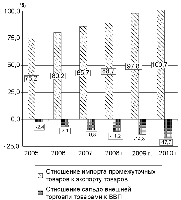
Рис. 3. Отношение импорта промежуточных товаров к экспорту товаров и отношение сальдо внешней торговли Республики Беларусь к ВВП в 2005–2010 гг.

1. Устойчивый рост отрицательного сальдо внешней торговли был обусловлен преимущественно удорожанием импорта природного газа, сырой нефти, черных металлов и других первичных сырьевых ресурсов, что предопределило формирование опережающего роста промежуточного импорта по сравнению со стоимостным объемом товарного экспорта.