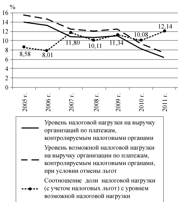
Рис. 2. Показатели налоговой нагрузки, рассчитанные как отношение налоговых платежей от организаций, контролируемых налоговыми органами, к объему выручки по экономике.

При общей тенденции снижения налоговой нагрузки на экономику наблюда-