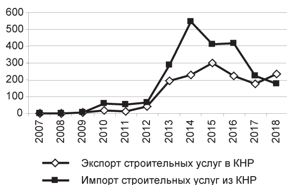
Рис. 3. Экспорт и импорт строительных услуг из КНР, млн долл.

20% в общем экспорте белорусских услуг в КНР составляют транспортные, связанные с экспортом калийных удобрений (рис. 4). Отклонения между двумя показателями возникают из-за колебаний цен на калий и изменений в экспорте услуг разных видов транспорта. При этом ежегодный многократный рост железнодорожных перевозок по маршруту Китай – Европа через Беларусь не смог отвязать экспорт транспортных услуг от экспорта калия, так как китайско-европейские железнодорожные перевозки обслуживают-