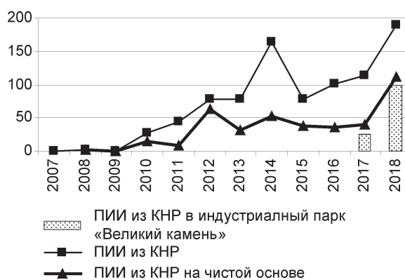
Рис. 6. Прямые китайские инвестиции в Беларусь, млн долл.