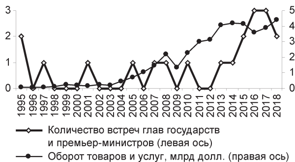
Рис. 1. Общее число двусторонних встреч высшего руководства Беларуси и Китая 1 и взаимный оборот товаров и услуг

нии, ценностях и интересах, определяемых их лидерами (см. подробнее Bougon, 2018). Возросший политический «капитал» стал конвертироваться в экономические (количественные) выгоды для Беларуси по ряду направлений.