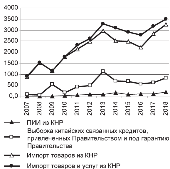
Рис. 2. Импорт товаров и услуг из КНР, выборка китайских связанных кредитов, прямые китайские инвестиции в Беларусь, млн долл.

Выявлена зависимость общего импорта китайских товаров и услуг примерно на 20% от масштаба инвестпроектов, реализуемых при поддержке связанных китайских кредитов (рис. 2). Коэффициент корреляции между импортом китайских товаров и услуг и выборкой китайских кредитов, предоставля-