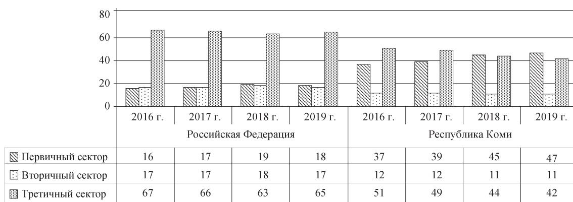
Рис. 2. Секторальная структура валовой добавленной стоимости Российской Федерации и Республики Коми, 2016–2019 гг., %