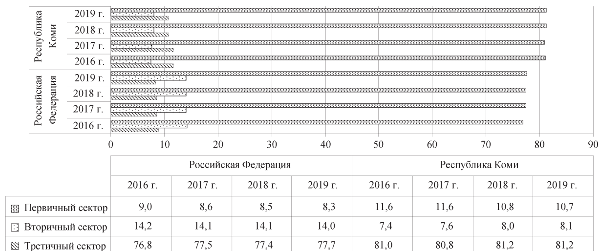
Рис. 3. Секторальная структура среднегодовой численности занятых в Российской Федерации и Республике Коми, 2016–2019 гг., %