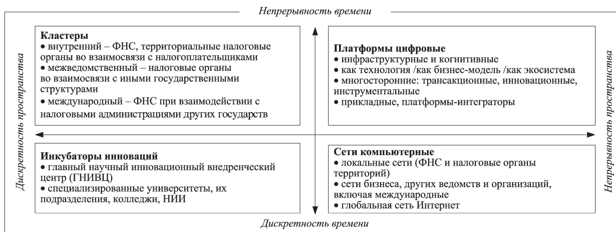
Рис. 1. Агрегат кластеров, платформ, сетей и инкубаторов: налоговый аспект

Наименования представлений (разрезов, образов) содержательной части ГМНЭ и виды обеспечения (инструменты) обозначаются на рис. 2.