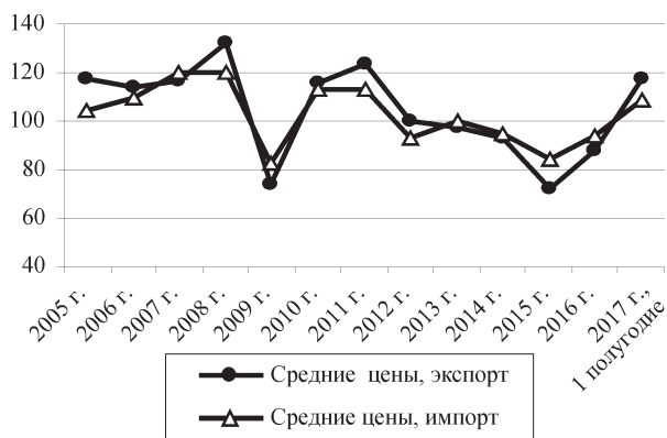
Рис.1. Индексы средних цен экспорта и импорта товаров Республики Беларусь в 2005–2017 гг., % к уровню предыдущего года

Источник. Статистический ежегодник Республики Беларусь. 2016. Минск: Национальный статистический комитет Республики Беларусь, 2016. 518 с.; Социально-экономическое положение Республики Беларусь в январе 2017. Минск: Национальный статистический комитет Республики Беларусь; Социально-экономическое положение Республики Беларусь в январе–июле 2017. Минск: Национальный статистический комитет Республики Беларусь.