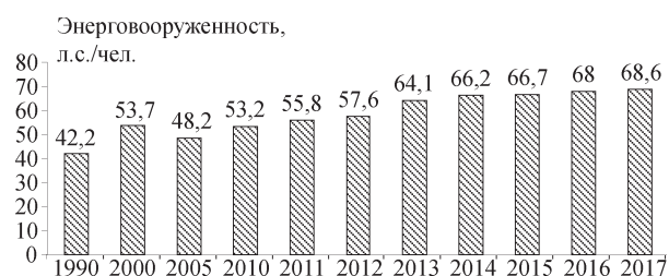
Рис. 1. Энерговооруженность сельскохозяйственного труда в Республике Беларусь, л.с./чел.

Произошли значительные изменения и в социальной сфере. Создана разветвленная сеть агрогородков, обеспечивающая со-