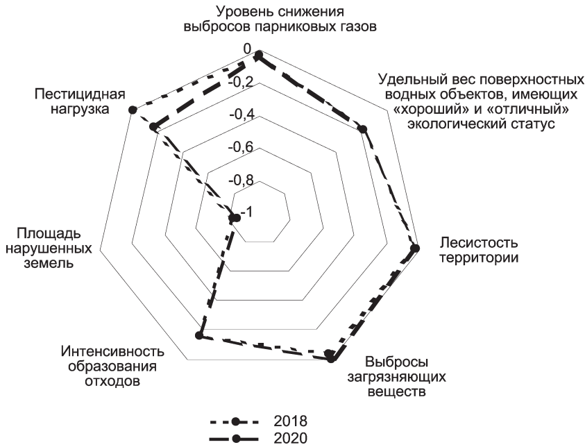
Рис. 2. Уровень достижения экологических показателей в 2018 и 2020 гг. по отношению к целевым ориентирам 2035 г. (по НСУР-2035)